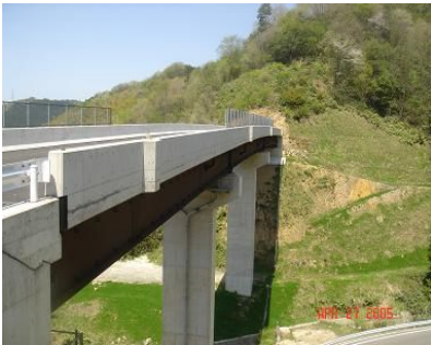
早期再開が待たれる 吉田インター線トンネル