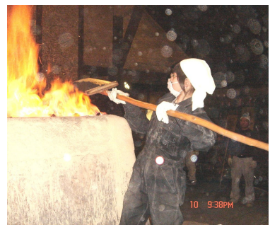
昨年に引き続きたたら体験に参加した和光大学の女子学生さん。頑張っています。

今年も十一月十日朝から十一 日朝にかけて近代たたら操業 が行われ、今年も東京・福 岡などから二十三名の熱心 なたたらファンが集まり、24 時間の操業に取り組みました。 砂鉄約700キログラム、木炭約70 0キログラムを投入し、出来た鋼(け たら)約150キログラム、迫力あるた たら吹きでした。 近代たたらは昭和63年 『和鋼生産研究開発施設』とし て作られ、本物の約三分の一の 大きさです。外枠は耐火煉瓦と 超硬合金で作られており、繰り 返し使用、内側の土をそのつど 作り変え、作業します。 操業時間は約24時間、三分 の一は交互投入は重労働です。 木炭の交互投入は重労働です。 現代人が忘れかけたものづく りの厳しさと、できた時の喜び を全身で体験できます。 在来からの「たたら操業」は現 在奥出雲町横田で行われてい ます。近代たたらは規模こそ小 さいとはいえず、原料も操業シ ス